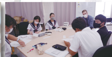
IUC English Camp