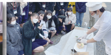
日越祭 in Nakamura