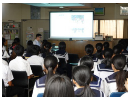
説明会場 (コンピュータ室)

本日は、中村高校の学校説明会にお越しいただき、ありがとうございました。中村高校での高校生活を想像してみてください。きっと皆さんが1人1人が楽しいと思えるような生活が送れると思います。皆さんの残り少ない中学校での生活が充実したものになるよう、祈っています