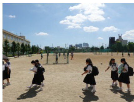
活動中の部活は 見学できます